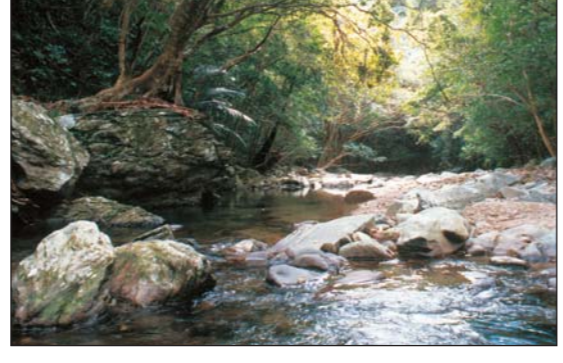
48 久米島の溪流・湿地