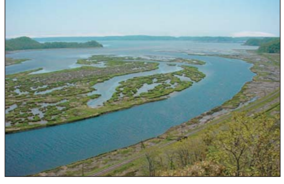
11 厚岸湖・別寒辺牛湿原