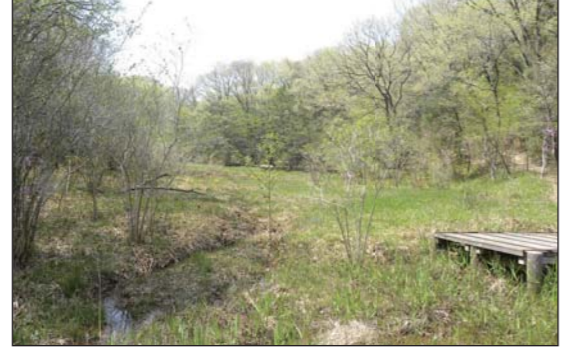
33 東海丘陵湧水湿地群