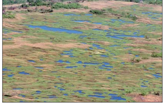
29 立山弥陀ヶ原・大日平