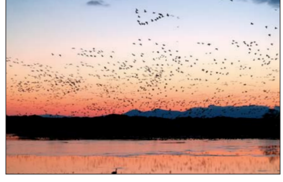
16 蕪栗沼・周辺水田