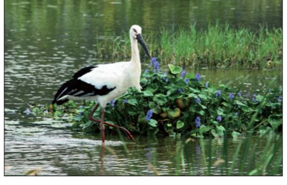
36 円山川下流域・周辺水田