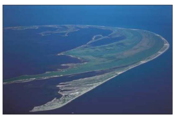
5 野付半島・野付湾