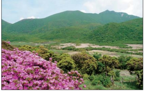
45 くじゅう坊ガツル・タデ原湿原