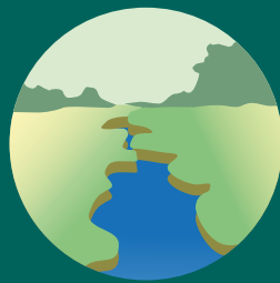
干ばつを緩和する