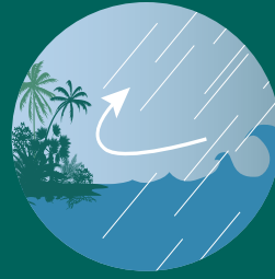
高潮による影響を軽減し、海岸線を守る