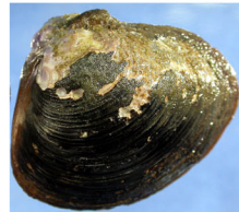
ヤマトシジミ(砂底～泥底)