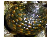
インダタミ (石に付着)