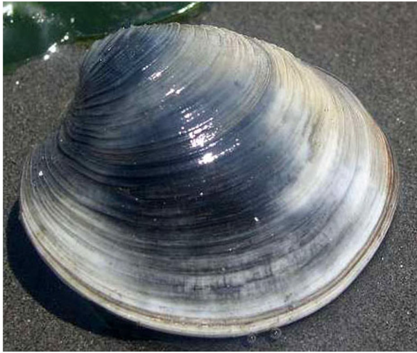
ホンビノスガイ(泥底)