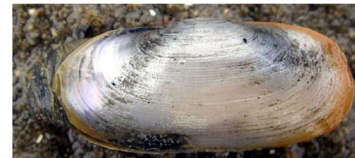
ソトオリガイ(砂泥底)