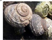
タマキビ (護岸に付着)