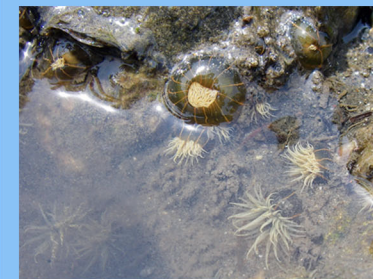
タテジマイソギンチャク (護岸や棒杭に付着)