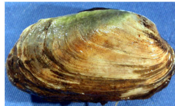
ウネナシトマヤガイ(岩やカキ殻に付着)