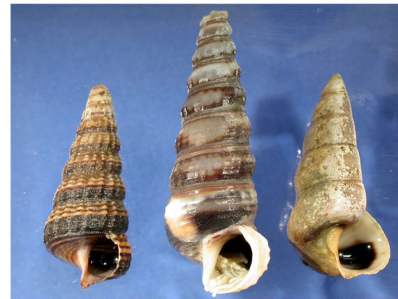
フトヘナタリ(ヨシ原)