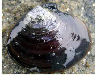
イソシジミ(砂泥底)