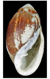
オカミマガイ (ヨシ原)