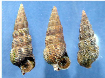
ホソウミニナ (砂底～泥底)