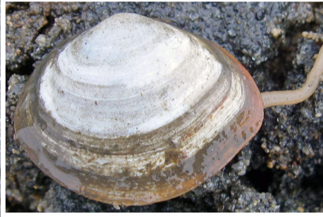
サビシラトリ(泥底)