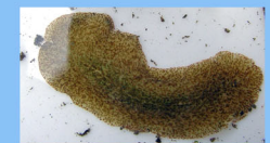
ヒラムシ類 (砂泥底)