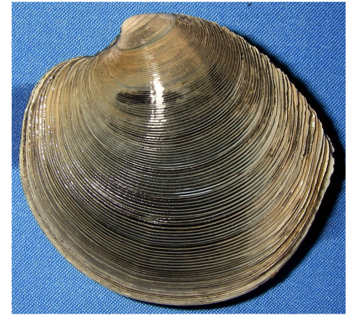
カガミガイ(砂泥底)