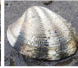
アサリ(砂底～砂泥底)