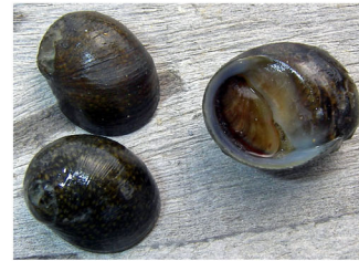
イシマキガイ (石や護岸に付着)