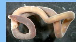
ナミヒモムシ (砂泥底)

制作: 鈴木孝男 日本経団連自然保護基金の助成金を利用して作成したものを元にしています。