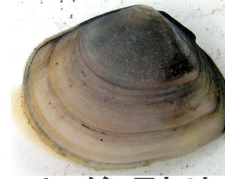
ヒメシラトリ(泥底)