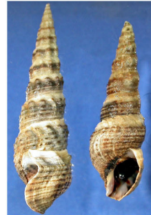
イボウミニナ (砂底～砂泥底)