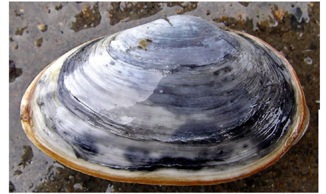
オオノガイ(内湾奥の泥底)