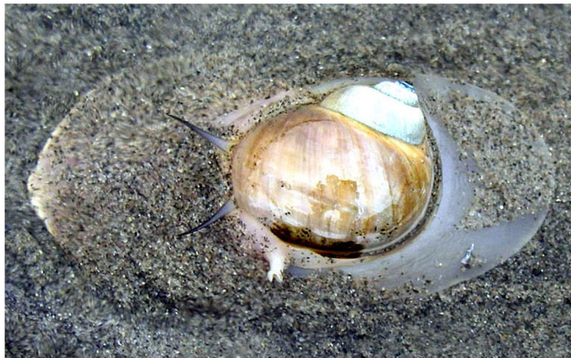
サキグロタマツメタ(砂底～砂泥底)