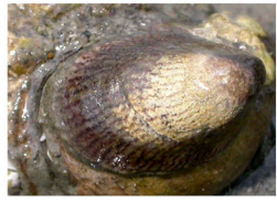
シマメノウフネガイ (貝類の殻に付着)