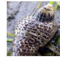
ツボミガイ (ウミニナ類 に付着)